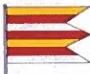
Obrázok č. 5

pozostáva zo siedmich pozdĺžnych pruhov vo farbách žltej, červenej, bielej, červenej, žltej, červenej a bielej. Vlajka je ukončená tromi cípmi.