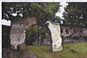
Obrázok č. 9

Presné údaje o tom, kedy bol Toporecký kaštieľ postavený nie sú známe, ale vyplývajú z faktov, že Toporec bol od prelomu 13./14. stor. sídlom rodu Görgeyovcov, je možné predpokladať, že najstaršia časť kaštieľa mohla pochádzať ešte zo začiatku 14. stor. Postupný stavebný vývoj kaštieľa nie je doposiaľ známy, nakoľko sa na objekte neuskutočnil archeologicko-architektonický výskum, ktorý by pomohol odhaliť dejiny objektu.