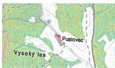
Obrázok č. 11

V miestnom kostole na ich rodinnom erbe z prvej polovice 17. storočia je vyobrazený symbol - lipový strom.