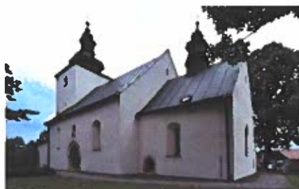
Obrázok č. 6

Sakrálny objekt bol vybudovaný na menšej vyvýšenine (573 m n. m.) zarovnannej terasy Toporeckého potoka, na južnom okraji Spišskej Magury. Stavba vznikla v rámci významného