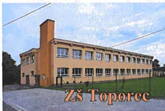
Obrázok č. 12

➤ Základná škola Toporec, Školská 7/6, 059 95 Toporec