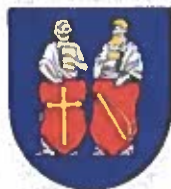
Obrázok č. 4

Erb obce: v modrom štíte dva červené štíty, v prvom zlatý kríž, v druhom zlatý súkenický slák, za štítmí sú ako nosiči strieborní zlatovlasí sv. Filip a sv. Jakub ml., každý drží na hrudi zlatú knihu.