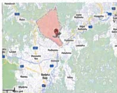
Obrázok č. 2

Obec leží na južnom úpätí Spišskej Magury, vzdialená asi 2 km od rázcestia do Podolínce v 6 km dlhom údolí, ktoré sa tiahne od rázcestia, kde je zastávka železničnej trate, na sever; cesta vedie ďalej cez sedlo Javor do Veľkej Lesnej a do Červeného Kláštora. Je to najkratšie spojenie z údolia Popradu do údolia Dunajca. Celková rozloha obce je 28,12 km 2 .