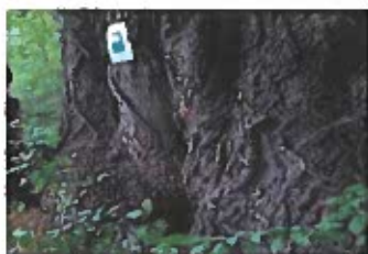
Obrázok č. 10

Pri majeri Pustovec sa nachádza chránený strom – lipa veľkolistá ( Tilia platyphyllos scap. ) s výškou 33 m, s obvodom 786 cm, korunou 20 m. Jej vek sa odhaduje na 550 rokov. Na rozdiel od väčšiny iných, starších líp na Slovensku, z ktorých sú už len dožívajúce torzá, lipa na Pustovci je v dobrej kondícii. Je jednou z troch líp, ktoré údajne vysadili traja synovia rodiny Görgeyovcov.