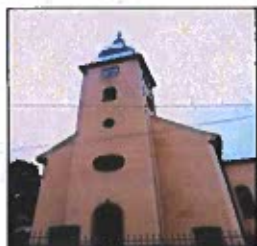
Obrázok č. 7

V súčasnosti sa jedenkrát do roka v kostole konajú Služby Božie za účasti evanjelických veriacich z okolitých obcí a potomkov bývalých nemeckých občanov obce.