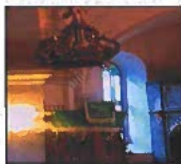
Obrázok č. 8